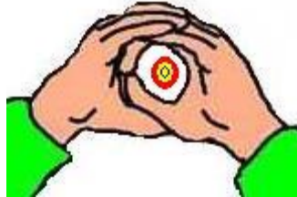
Mains collées avec un objectif