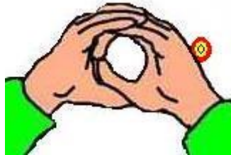
Mains collées vu gauche